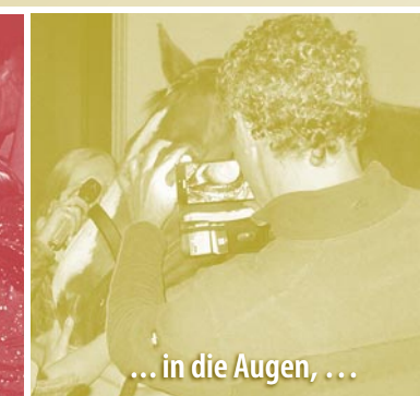
... in die Augen, ...