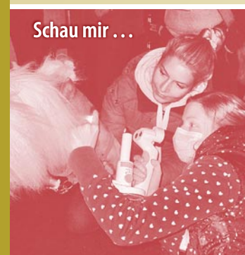
Schau mir ...